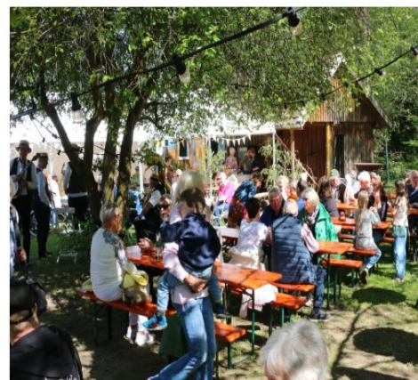
Text: WHU, Samstag, 02. Mai 2026, Dienstag, 05. Mai 2026, Verdener Aller-Zeitung/ Langwedel