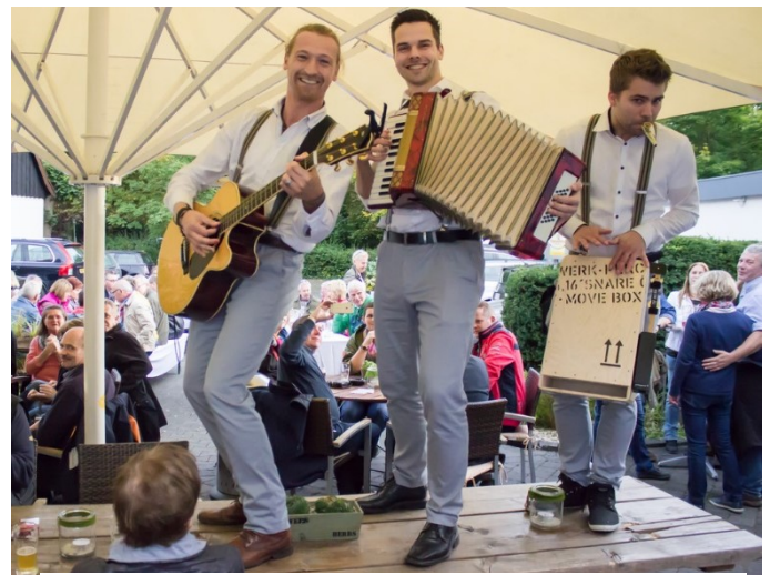
Band „Modern Walking“

Vor, neben, hinter und über den Gästen wird das gesamte Repertoire als mobile Band im Publikum live gespielt. Musik zum Anfassen, Mitmachen oder einfach nur zum Zuhören.